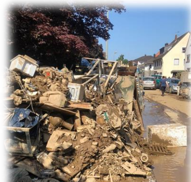
Aktuelles Foto aus Ahrweiler